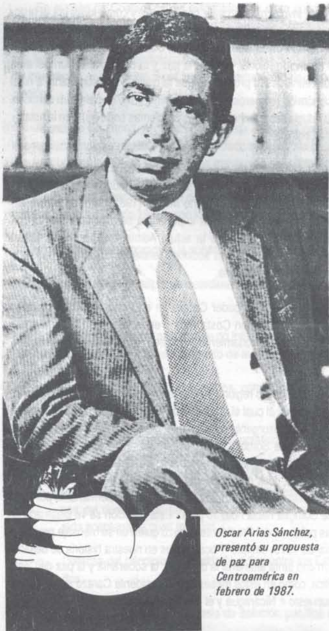
Oscar Arias Sánchez, presentó su propuesta de paz para Centroamérica en febrero de 1987.

A estos esfuerzos se unieron otros como el del Grupo de Apoyo a Contadora, el Grupo de los Diez, el Grupo de Países No Alineados, los países de Europa Occidental y el Grupo de los 77, quienes con su apoyo moral, político y en ocasiones, financiero, quisieron aunarse a los esfuerzos que hace esta frágil región para salir adelante de una crisis que es muy suya, interna, pero que se