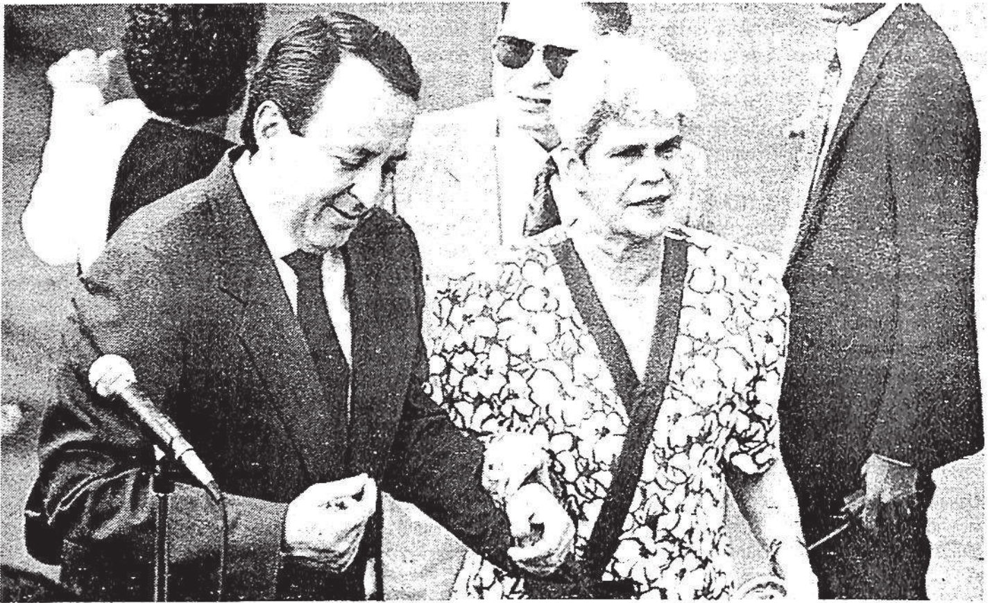
La Presidenta de Nicaragua, Violeta Barrios de Chamorro, y el Presidente costarricense, Rafael Angel Calderón, se encontraron durante la XII Cumbre Centroamericana, celebrada en Managua, Nicaragua.

acuerdo persigue ayudar a la balanza de pagos de Costa Rica, mejorar el equipamiento industrial y constituir un fondo de contrapartida en colones, destinados a proyectos de carácter socioeconómico. (N. R. 9 junio)