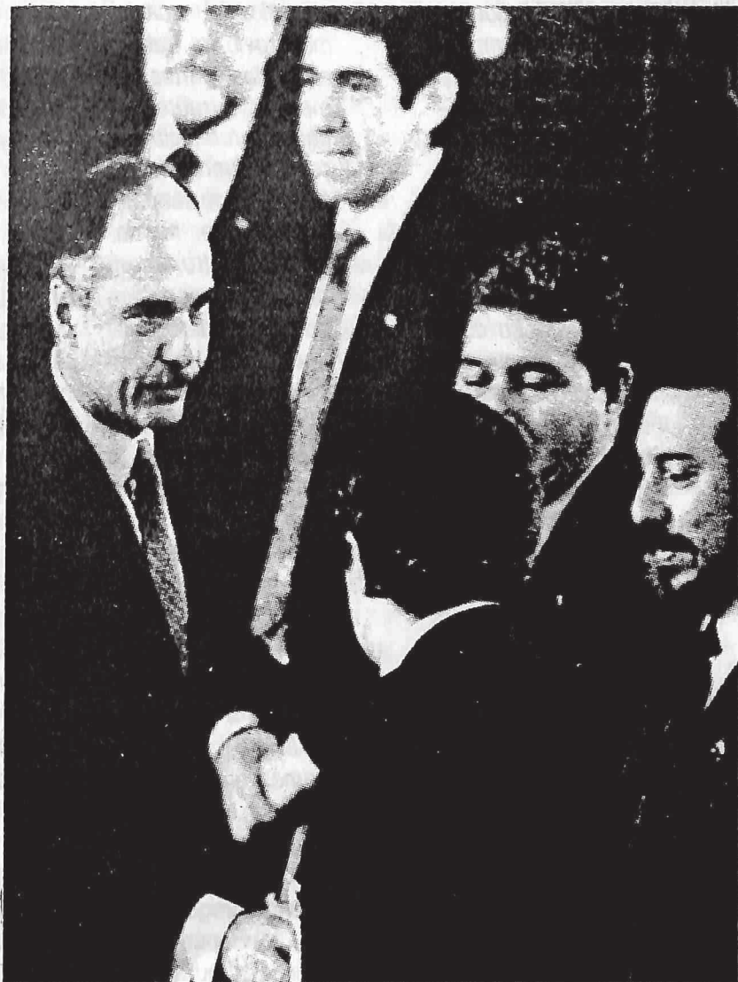
Alfredo Cristiani Burkard al asumir la Presidencia de la República expresó que su Gobierno haría todos los esfuerzos posibles a fin de alcanzar la pacificación del país.

En el discurso de toma de posesión el Presidente