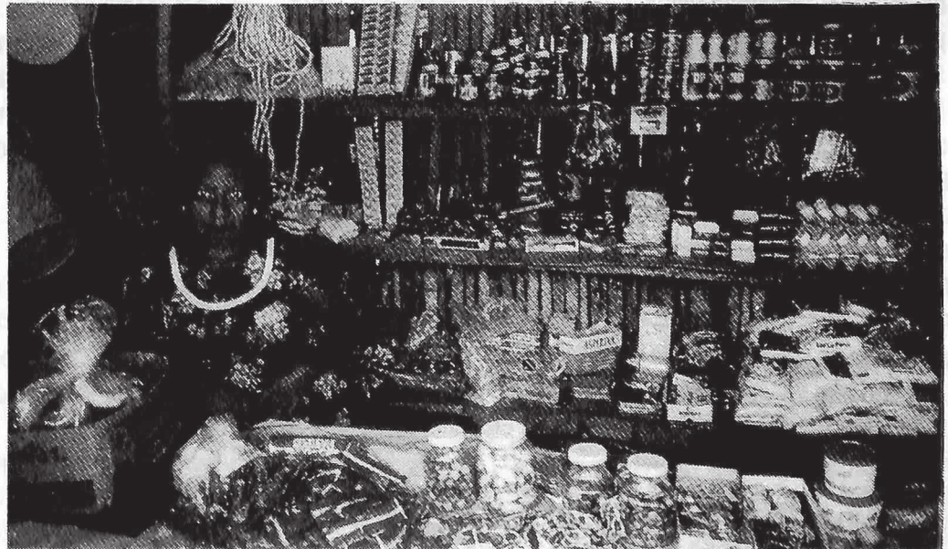
El trabajo y el aporte de los salvadoreños será vital para superar esta etapa.