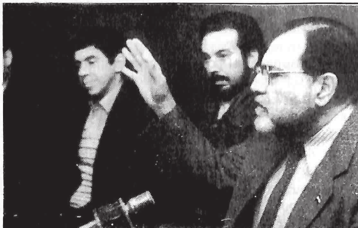
Una vez finalizada la confrontación armada, el FMLN entra a la escena política al igual que los otros sectores que ya se encuentran participando. Aquí varios de sus comandantes.

Otro de los aspectos que la guerrilla tiene que