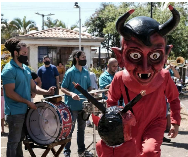
Figura 8. Mascarada de Verano, 2021