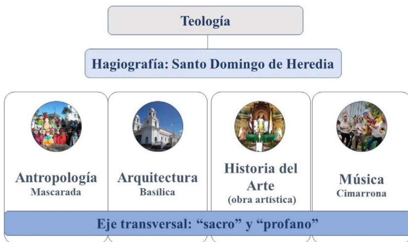
Figura 9. Eje de transversalización para un estudio hagiográfico de Santo Domingo

La interdisciplina fomenta la transversalidad ( Figura 9 ), la cual consiste en un enfoque de trabajo colectivo entre disciplinas que establecen asociaciones conceptuales y metodológicas para analizar un tema en particular. En el caso hagiográfico de Santo Domingo, varias disciplinas permiten establecer conexiones. Por ejemplo, se puede mencionar la relación previamente mencionada entre la dimensión teológica y musical de la celebración hagiográfica domingueña, en relación con la noción de lo “sacro” y lo “profano”.