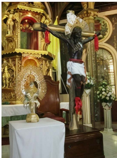
Figura 4. Cristo Negro de Esquipulas, Dulce Nombre de Cartago

Fuente: Fotografía de Lizeth Calvo Díaz, 2022