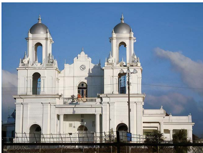
Figura 6. Basílica de Santo Domingo de Heredia

Fuente: Fotografía de Andrea Calvo Díaz, 2024