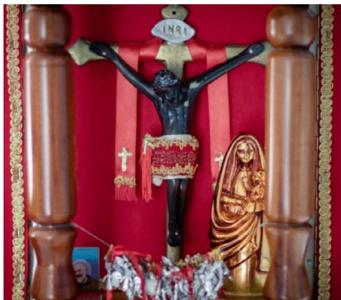
Figura 3. Cristo Negro de Esquipulas, Santa Cruz de Guanacaste