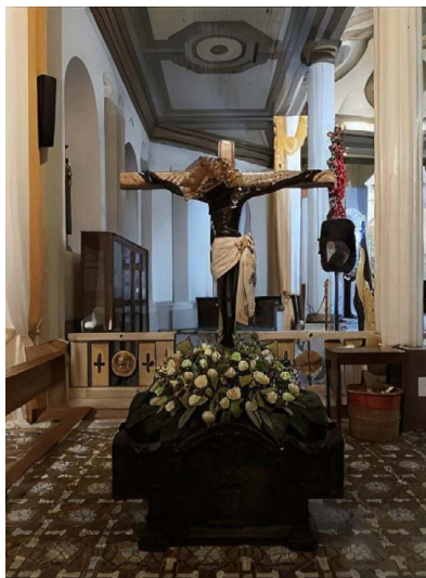
Figura 5. Cristo Negro de Esquipulas, Alajuelita