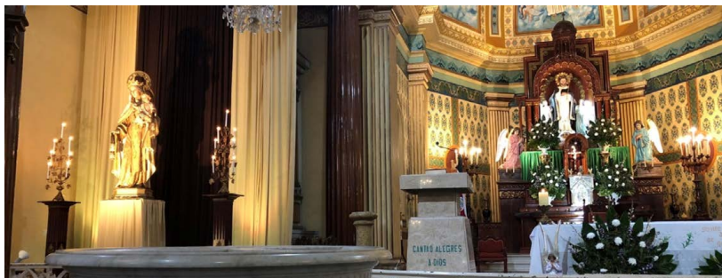
Figura 7. Imagen de Santo Domingo de Heredia