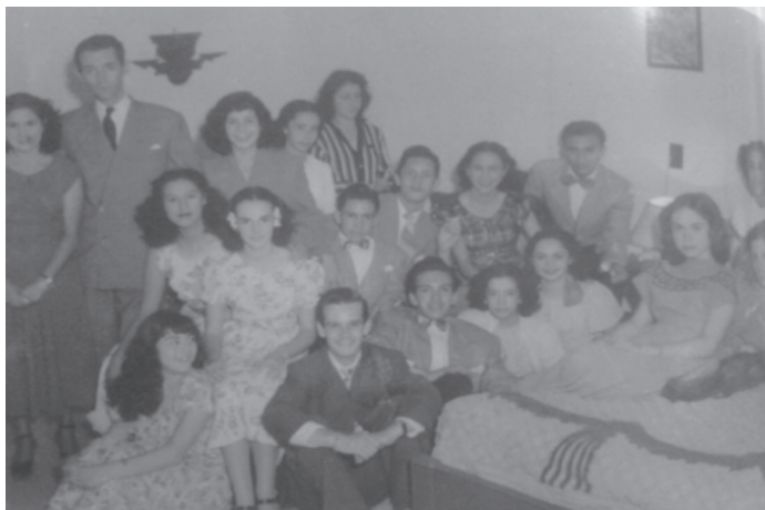
Fotografía 5. Fundadores del Ballet Guatemala. Antigua Guatemala, 1948.