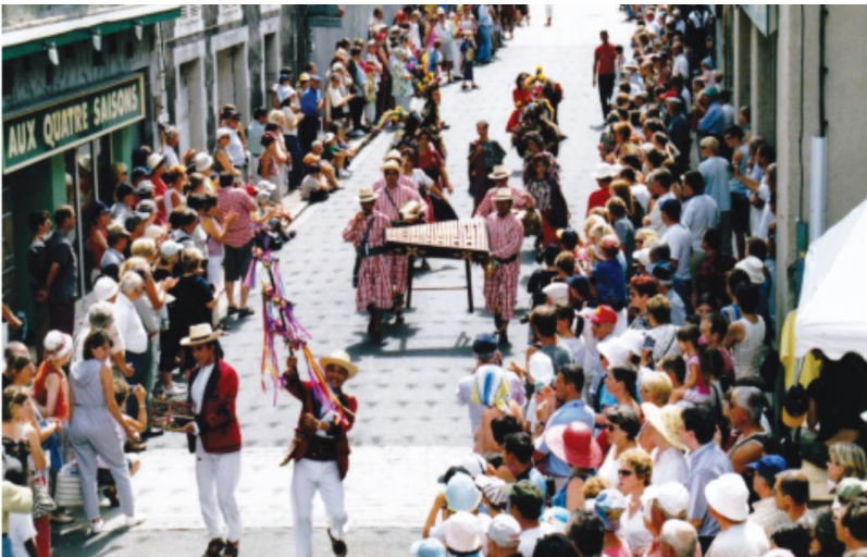
Fotografía 30. Gira a España, 1999.