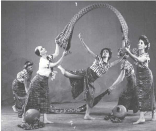
Fotografía 26. En el río , coreografía de Farnesio de Bernal.