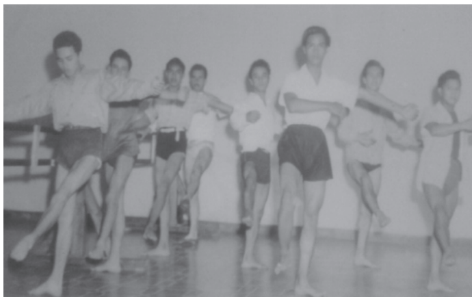
Fotografía 6. Clase de Danza en el Instituto Belén, enero de 1948.