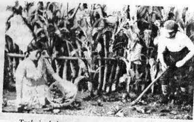
Trabajo de la mujer en la comunidad campesina

un proyecto educativo. El período colonial no cimentó una estructura educativa de avanzada. El sistema escolástico colonial no mantuvo una cobertura que beneficiara a las grandes masas rurales y en la región la mayoría de las áreas urbanas, eran sumamente deprimidas. Con el advenimiento de los estados liberales la región entró de lleno en el proceso de mercado de productos del sector primario, las masas campesinas formadas por agricultores tradicionales, sufrieron un rápido proceso de descampesinización, convirtiéndose en jornaleros de las grandes haciendas o en obreros fabriles de los sectores urbanos en desarrollo. De esta forma en muchas regiones la llamada comunidad campesina fue tomando el carácter de una población rural o de un asentamiento de empleados de la gran hacienda (campamentos de peonada, o cuadrantes de fincas en la gran plantación). Ya para este tiempo el contacto con el mercado era de total dependencia para la mayoría de los miembros de las familias rurales. La ruralidad se caracterizó en términos territoriales y estadísticos, refería al desarrollo de los servicios públicos básicos (vivienda, agua potable, alcantarillado, servicio eléctrico, caminos y estructura en calles y aceras).