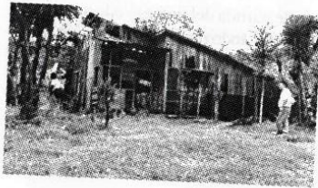
Casa de peones Hacienda Florencia

Esta situación nos muestra un patrón de desterritorialización comunal, que va apareciendo cada vez con más frecuencia en los campos de nuestros países. A la vez nos interroga sobre el quehacer educativo, con los hoy denominados, grupos de comunidad. En este aspecto es importante tratar de analizar las características que involucran el concepto de comunidad en la actualidad. Como se ha dicho el fenómeno espacial como elemento