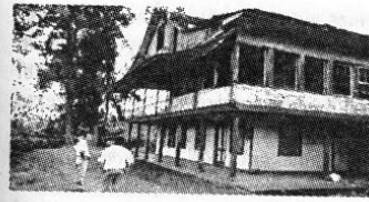
Casa de administración Hacienda Florencia