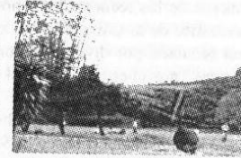
Ruinas del ferrocarril Hacienda Florencia