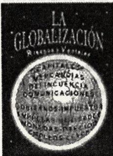
34 • Temas de Nuestra América

Las mujeres han sido excluidas de los principales pilares de los poderes públicos: la política y el derecho. Apartadas del Estado desde sus inicios, no es extraño que éste se haya diseñado a la medida de los varones. Aún incluso el estado del bienestar, ha tenido para las mujeres una doble moral: opresora y protectora.