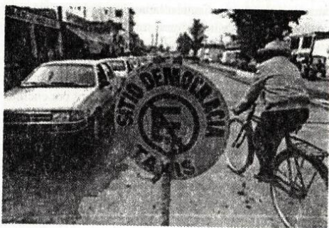
164 • Temas de Nuestra América

geoestrategia de las potencias, la composición mantiene un control centralizado de poder, totalmente desigual. Cuando se habla de " democracia cosmopolita " con frecuencia se alude a la idea de una democracia centrada en un nuevo orden mundial, que crea un status de ciudadano del mundo y en donde los estados nacionales son únicamente mediaciones y en donde el Consejo de Seguridad asuma un rol de Ejecutivo. Sin embargo no se puede negar que las debilidades estructurales de la ONU, mostradas fundamentalmente en las últimas décadas y que en mucho han significado la paralización de muchos de los programas orientados por los diferentes organismos que le componen, no contribuyen a que se le legitime, principalmente en garantizar la " inclusión " en el proyecto global de un orden económico mundial, solidario con los intereses sociales de los estados más desprotegidos.