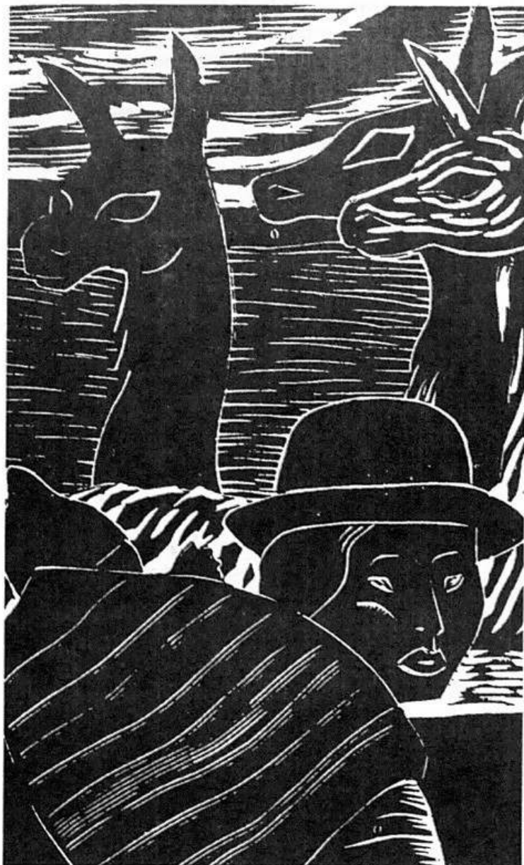
Francisco Amighetti Grabado Costa Rica