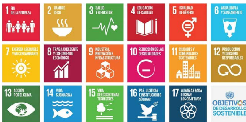
Figura 1. Objetivos de desarrollo sostenible, UNESCO (2017).

En sintonía con la UNESCO, para alcanzar estos objetivos es necesario contar con una educación holística, integradora y transformadora que considere: a) contenidos y los resultados de aprendizaje; b) la pedagogía y entornos de aprendizaje; c) frutos del aprendizaje; y d) transformación social. En definitiva, se trata de un desafío que requiere una evolución de la enseñanza al aprendizaje para educar a las actuales y futuras generaciones en sostenibilidad, con el propósito de “desarrollar competencias que permitan a las personas reflexionar sobre sus propias acciones, teniendo en cuenta sus impactos sociales, culturales, económicos y ambientales actuales y futuros, desde una perspectiva local y global” (UNESCO, 2017, p. 7). De esta manera, se espera que a través de la EDS las generaciones actuales y futuras puedan alcanzar aprendizajes cognitivos, socioemocionales y conductuales específicos, y, sobre todo, desarrollar competencias clave de sostenibilidad, requeridas para contribuir a la comprensión y al logro de cada uno de los desafíos particulares de los ODS (Rieckmann, 2012). Esto trae consigo la necesidad de generar instancias de crecimiento profesional del profesorado que les permitan incorporar competencias clave de sostenibilidad (UNESCO, 2017) y