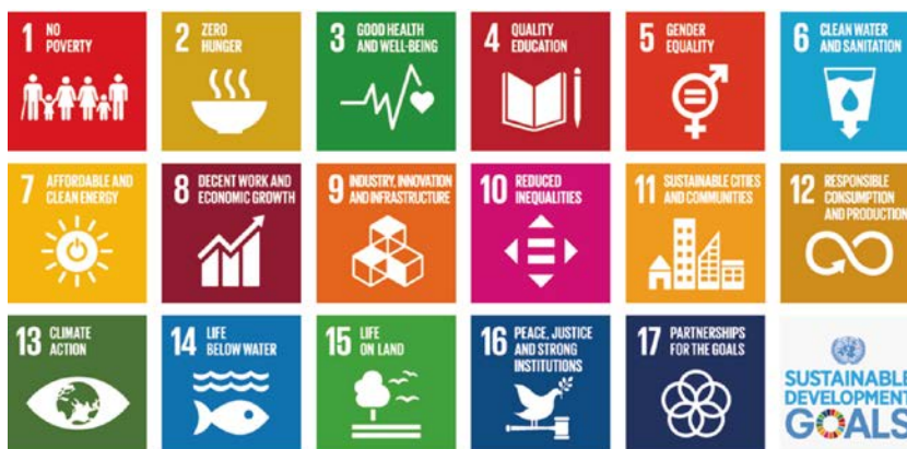
Figure 1. Sustainable development goals, UNESCO (2017).

three major dimensions of action in this field are recognized from the UN: economic, social and environmental, from which the 17 Sustainable Development Goals (SDGs) (UNESCO, 2017) that address a wide variety of themes are suggested (Figure 1):