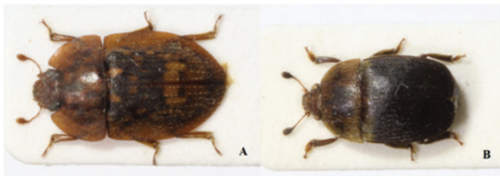
Figura 4. Escarabajos que podrían confundirse con el Pequeño Escarabajo de la Colmena. Lobiopa insularis (A) y Aethina villosa (B) (Solís 2017).

Diagnóstico diferencial con escarabajos adultos de otras especies: En Costa Rica, están descritas, en la familia Nitidulidae , algunas especies de escarabajos saprófitos, con una apariencia similar a A. tumida , por lo cual, pueden confundirse al encontrarse en las colmenas de abejas. Entre estos escarabajos se puede mencionar las especies: Lobiopa insularis (Coleoptera: Nitidulidae: Nitidulinae) (Figura 4A) y Aethina villosa (Coleoptera: Nitidulidae) (Figura 4B). Una característica que permite orientar el diagnóstico diferencial es que los escarabajos L. insularis y A. villosa , poseen alas largas, las cuales cubren completamente el abdomen (Figura 4), mientras que en A. tumida , las alas son cortas, dejando expuestos de 2 a 3 segmentos abdominales (Figura 2).