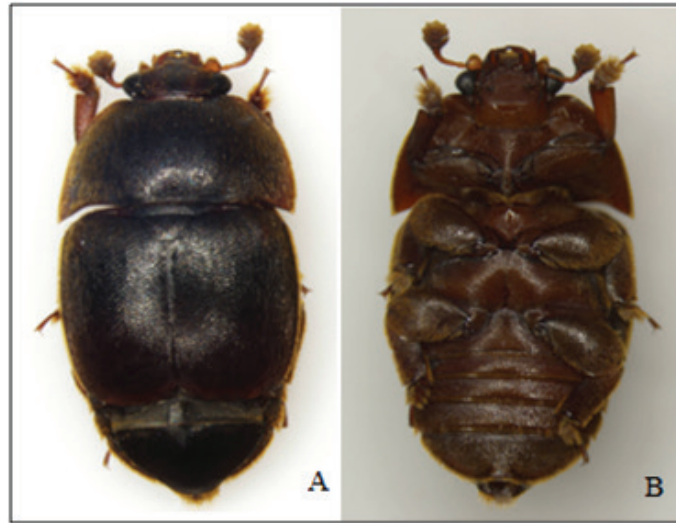
Figura 2. Vista dorsal (A) y ventral (B) de A. tumida (Ramírez & Calderón 2018).

el cuerpo y algo muy característico de A. tumida son las alas, las cuales son más cortas que el abdomen, dejando expuestos, de 2 a 3 segmentos abdominales (Figura 2A) (Stedman 2006; Calderón et al. 2014). En una vista ventral del escarabajo, se puede resaltar que sus patas son robustas (Figura 2B).